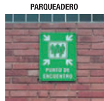
Evacuación sectorizada Evacuación general noche