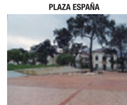
Evacuación general en el día

AL EVACUAR TENGA EN CUENTA LA RUTA DE EVACUACIÓN DEL ÁREA DONDE SE ENCUENTRE